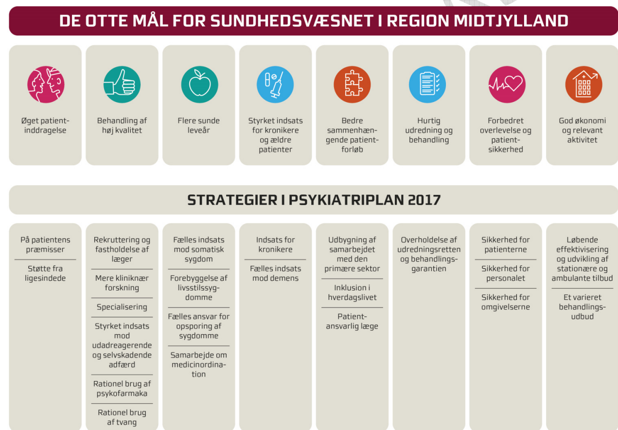
Figur 2: Sammenhæng mellem mål og strategier i Psykiatriplan 2017

Strategierne skal bidrage til, at psykiatrien i Region Midtjylland kan efterleve visionen om at skabe ”Bedre behandling og længere liv til flere med psykisk sygdom – på patientens præmisser” . Sammenhængen mellem de otte mål for sundhedsvæsnets og strategierne er illustreret i figur 2.