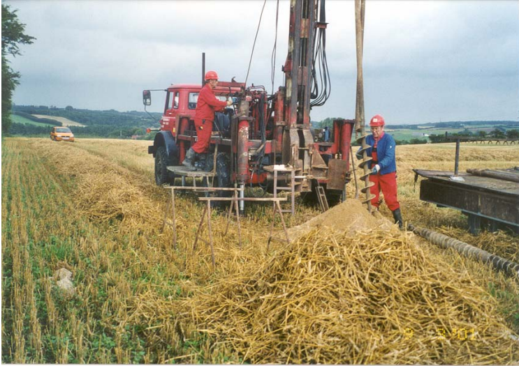
Undersøgelse efter sand, grus og sten.