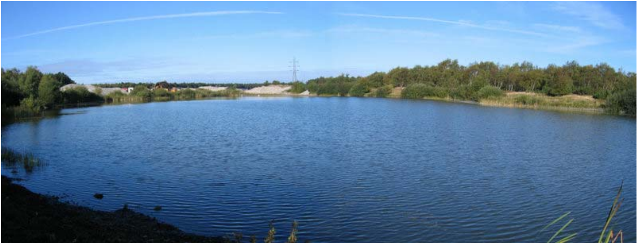
Efterbehandlet del af grusgraven – den aktive del ses i baggrunden