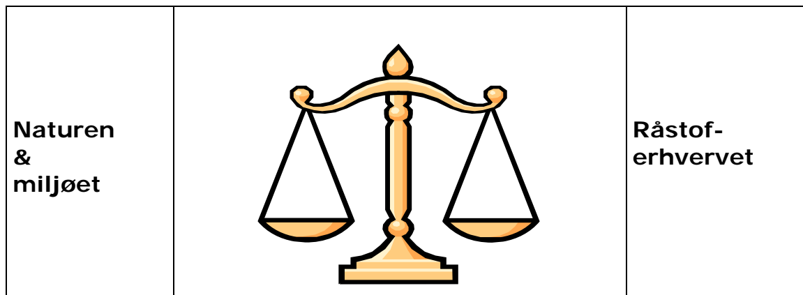
Fig. 2. Råstoflovens § 3.

Da der således vil ske en slags dobbelttjek i forhold til råstoflovens § 3, har regionsrådet valgt at se på den samlede miljøvurdering, som arealudlæg til råstofgravning vil medføre. Vurderingen ser derfor på konsekvenserne af forskellige alternativer.