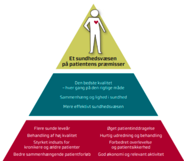
Region Midtjyllands målbillede og øvrige godkendte strategier