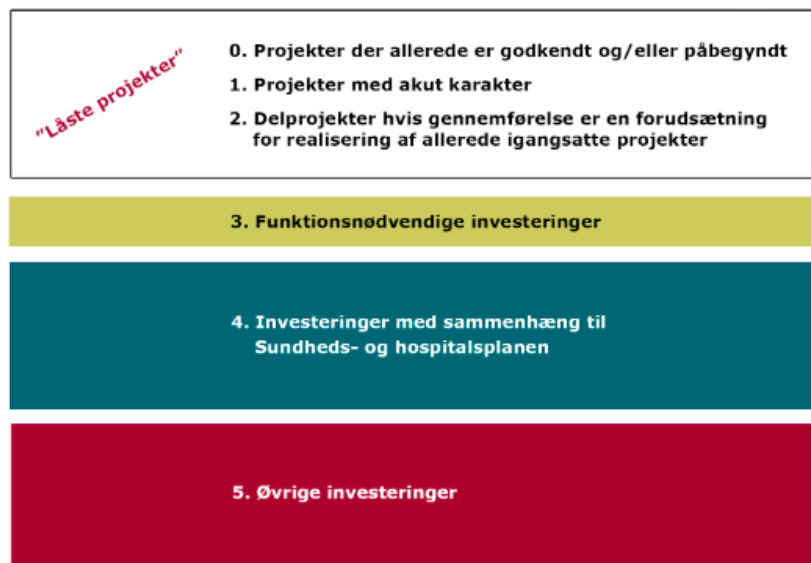
Kategorisering af anlægsinvesteringer