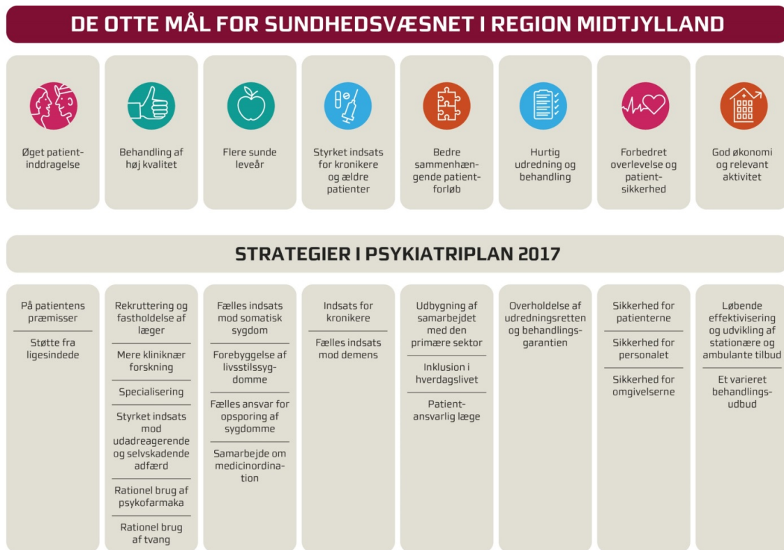
Figur 1: Sammenhæng mellem mål og strategier i psykiatriplanen

Det fremhæves i Psykiatriplan 2017, at Region Midtjylland ikke kan realisere strategierne alene, men er afhængig af indsatsen i og samarbejdet med kommuner, almen praksis og speciallægepraksis, som alle spiller en stor rolle i forhold til den brede gruppe af mennesker med psykisk sygdom.