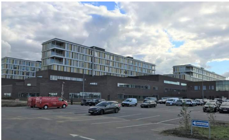
Byggeplads oktober 2021

Projekt nr.: 2019.033 Dokument nr.: 3-2021 Udgivelsesdato: 27.10.2021 Udarbejdet af: NIB Godkendt af: JA