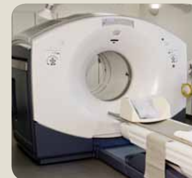
Foto og layout: Informationsafdelingen, Århus Universitetshospital, Skejby • U.180809LL

Auditorium B, Indgang 6 Århus Universitetshospital, Skejby