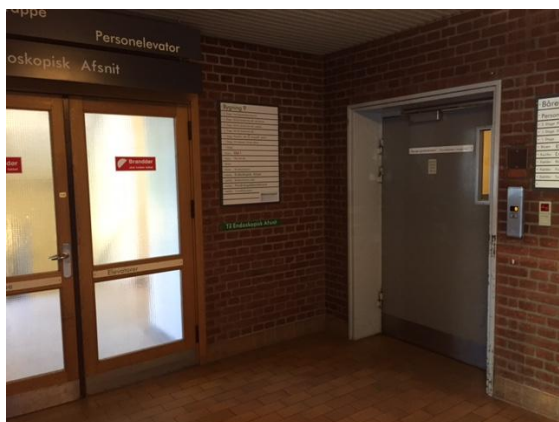
Tunnel til Blodbanksekspeditionen: