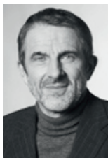
Steen Gade Formand for Folketingets Klima-, Energi- og Bygningsudvalg