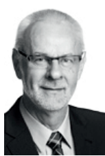
Flemming Eskildsen Borgmester i Skive Kommune