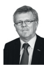
Iver Enevoldsen Borgmester i Ringkøbing-Skjern Kommune