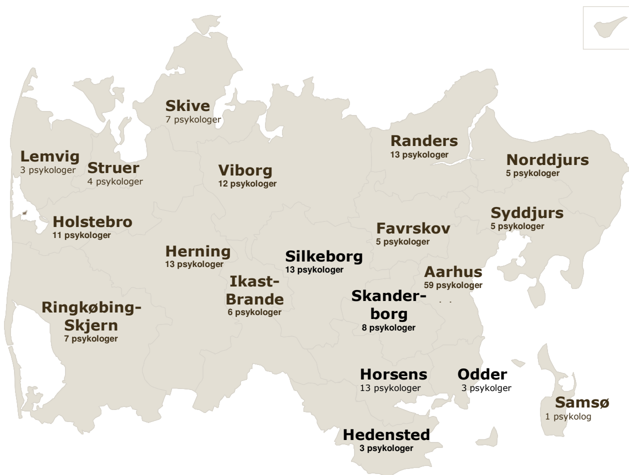
Figur 1 Psykologernes geografiske fordeling

Figur 1 viser fordelingen af psykologer fordelt på de enkelte kommuner.