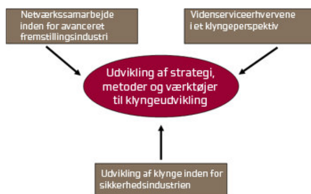
Figur 1 Pilotprojekter - klyngeudvikling

Projekterne er i første omgang designet til at teste og videreudvikle metoder og de første værktøjer til identifikation og udvikling af erhvervskluser i Region Midtjylland. Samt at styrke forudsætninger og muligheder for innovativt samarbejde og internationalt udsyn i nogle udvalgte vækstkluser og væksterhverv, der kan rumme potentielle vækstkluser.