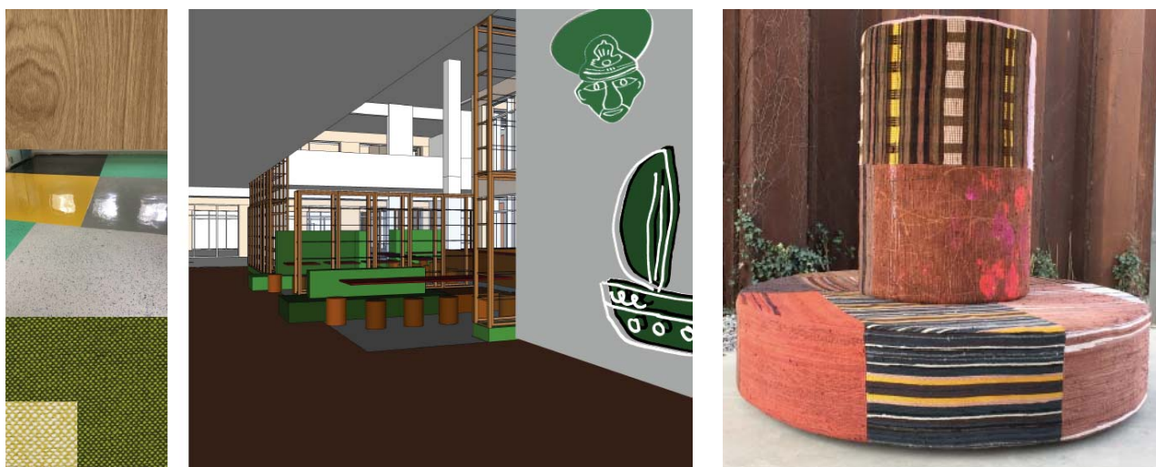
Illustrationer fra Tal Rs skitseforslag

Brugen af det kunstneriske materiale, som er hentet fra Museum Ovaraci, og fremvisningen af dette materiale på en respektfuld måde, skaber en dialog mellem nutidens brugere og historien og giver samtidig et sympatisk blik på et fagfelt, som ofte betragtes med fordomme og frygt. Gennem brugen af det historiske materiale tager Tal R vare på historien, men hans projekt handler imidlertid om mere end blot Psykiatriens rødder. Det adresserer vores liv i omskiftelige tider med udvidet mobilitet, digital kommunikation, øget ensomhed og mangel på forståelse for, hvor vi kommer fra, og hvilke relationer vi indgår i, som er meningskabende for os.