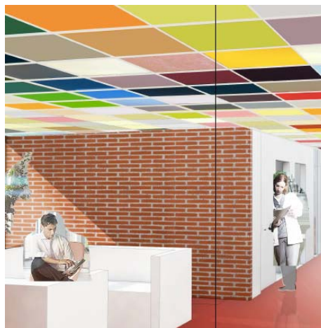
Illustrationer fra A Kassens skitseforslag