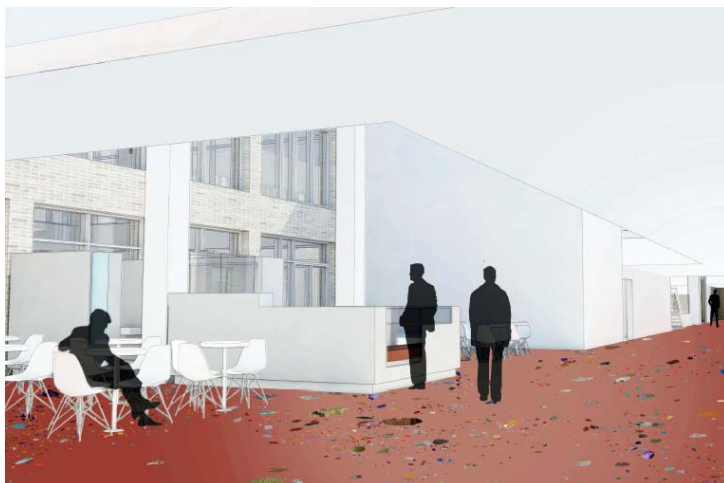
Illustrationer fra Tove Storchs skitseforslag