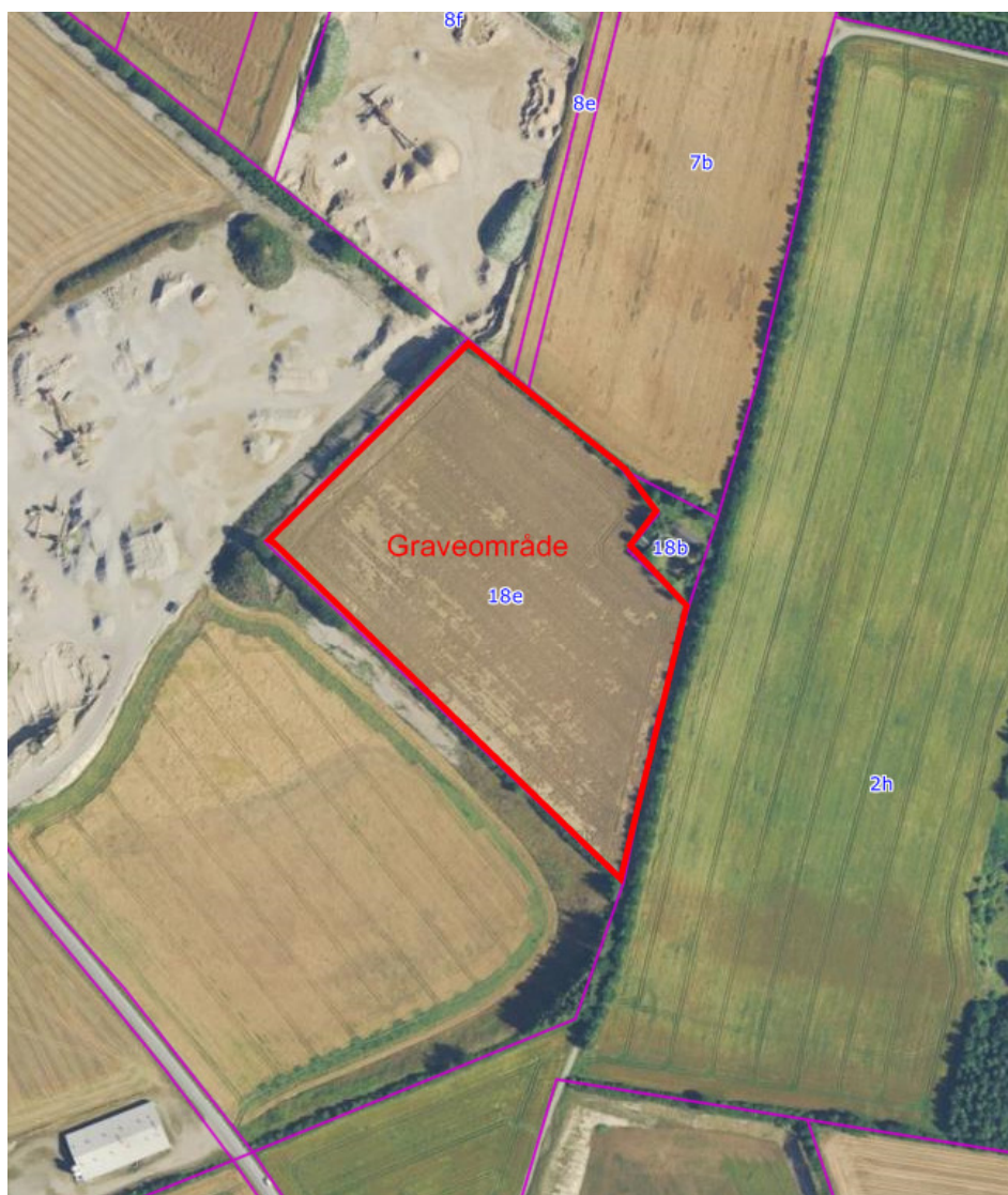
Kort over graveområdet