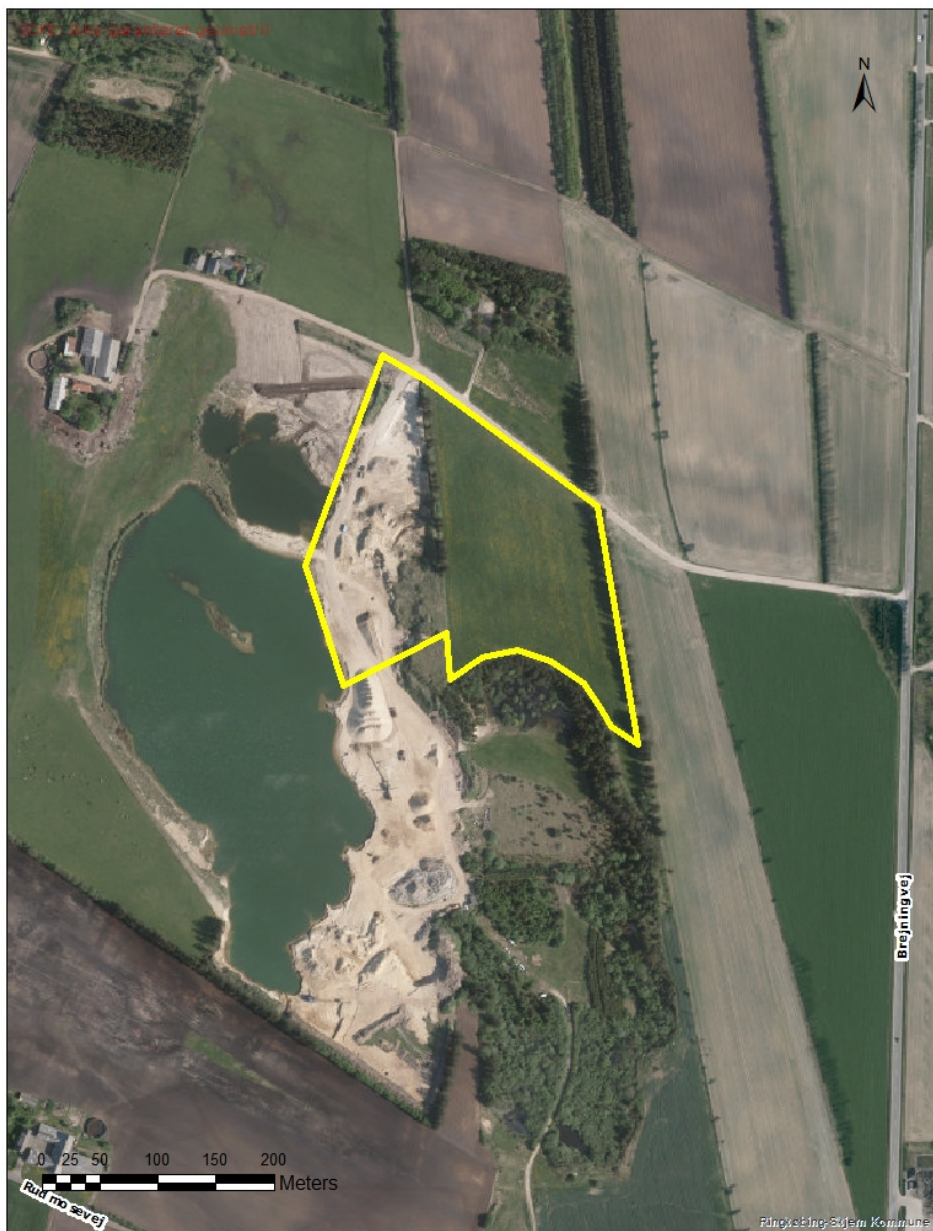
Figur 1: Omtrentt omfang af grundvandssenkning markeret med gult.