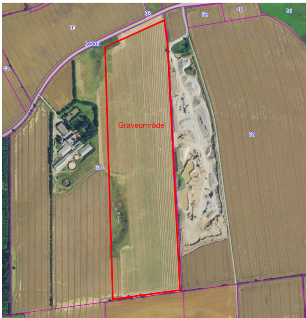
Kort over graveområdet