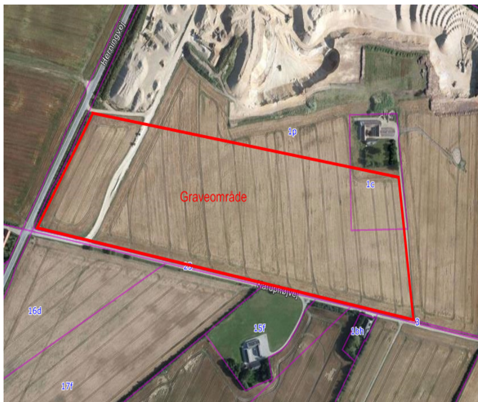
Kort over det ansøgte graveområde