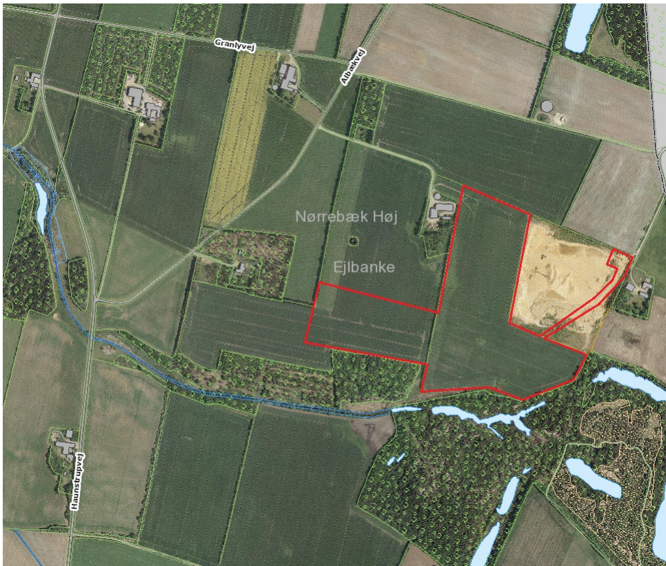
Figur 1: Omtrentlig omfang af grundvandssænkning, markeret med rødt.