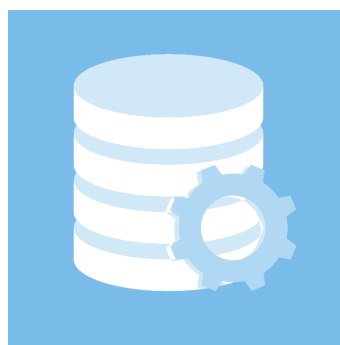
Database til stamdata og tableau til at trække rapporter til overblik.