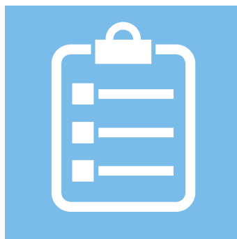
PRO spørgeskema til at vurdere livskvalitet, mobilitet og smerter