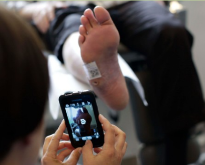
Telemedicinsk sårsvurdering går nu fra projekt til drift