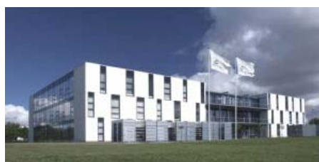
Afdelingen i Herning har lokaler i Innovatorium (tidligere BIRC Estate).