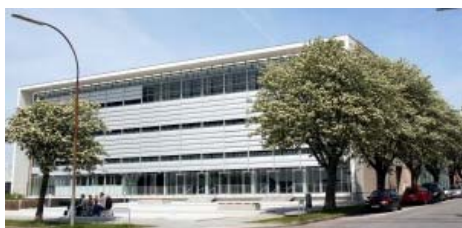
Hovedafdelingen er placeret i Incuba Science Park på Katrinebjerg i Århus.

Bestyrelsen besluttede at tilbyde medarbejderne i RES i Ringkjøbing Amt, TIC Viborg amt og Start og Vækst i Århus amt ansættelse i Væksthuset. Væksthuset har i dag 31 ansatte, hvoraf 26 er faglige medarbejdere/konsulenter. Til løsning af operatøropgaver ansættes yderligere medarbejdere.