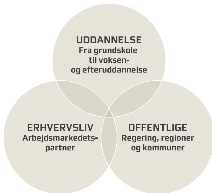
Figur 1: Partnerskabet for fremmedsprog i Region Midtjylland

Som en del af Den Midtjyske Strategi for Fremmedsprog gøres Det Midtjyske Sprogudvalg permanent som et operationelt partnerskab, hvor strategiens fremdrift vil blive fulgt og evalueret. Sprogudvalget består af repræsentanter fra både uddannelsessystemet, erhvervslivet og offentlige organisationer, hvorfor det er en essentiel aktør i det fremtidige arbejde med fremmedsprogene. Partnerskabet vil skabe sammenhæng til den nationale sprogstrategi og samtidig binde de politiske aktører, erhvervslivet og uddannelsesinstitutionerne tættere sammen, jf. figur 1.